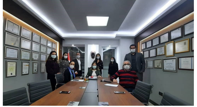
Eğitim Sonunda Hatıra Fotoğrafımız