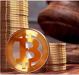
Bitcoin para mıdır, eşya mıdır?

Blok zinciri teknolojisinin geliştirilmesinin akabinde ilk olarak 2009 yılında üretilen bitcoinin hukuki durumu tartışmalıdır. Teknolojinin yaygınlaşmasının üzerinden geçen bunca zamandan sonra, kripto paraların artık hayatımızın vazgeçilmez bir parçası olacağını inkar etmek mümkün değildir.