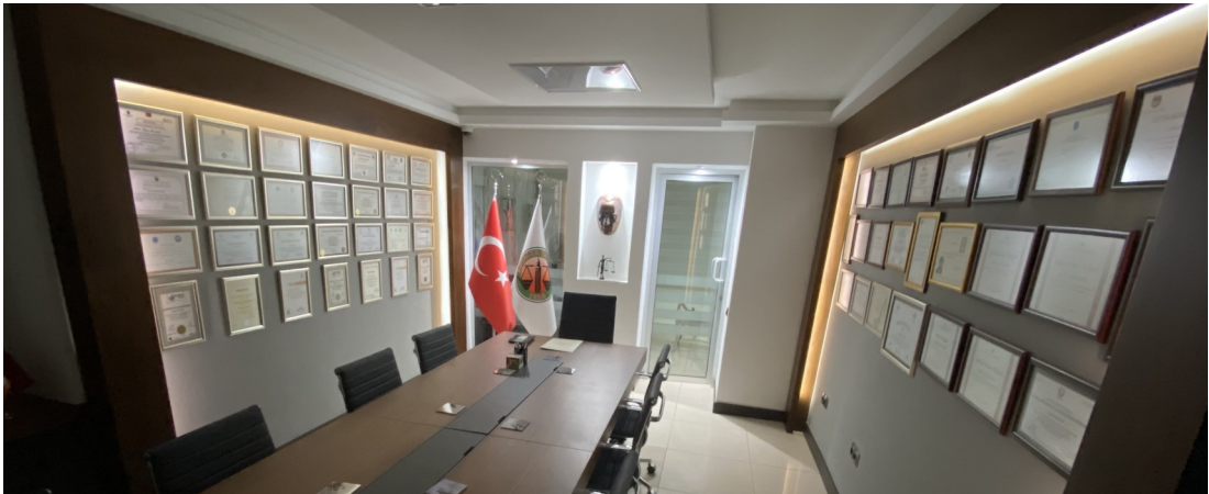
“Yeni Altınkan Hukuk Bürosu “

“Elektronik Ortamda Duruşmaya Giren Avukatlar Cübbe Giymeye Devam Edecek”